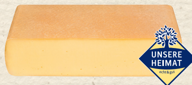
Unsere Heimat – echt & gut Raclettekäse

Schweizer Schnittkäse, mind. 45% Fett i. Tr., würzig, intensiv, mit Chiliflocken im Teig, zart, weichschnittig, 100 g