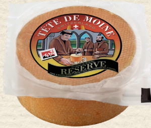
Emmi Tête de Moine Reserve

Französischer Weichkäse, mind. 50% Fett i. Tr. intensiv, aromatisch, weich, cremig, 100 g