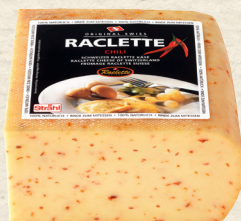
Raclette mit Chili

Deutscher Schnittkäse, mind. 50% Fett i. Tr., aus Demeter Heumilch von Kühen mit Hörnern, mit Kräutern und Knoblauch verfeinert, sahnig-milder Geschmack, 100 g