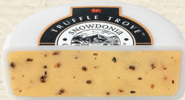
Snowdonia Truffle Trove

Landfrischkäse mind. 70% Fett i. Tr. und Räucherlachs mit feinem Schnittlauch abgerundet, 100 g