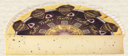
Fromager d'Affinois Trüffel

Österreichischer Schnittkäse aus Bio-Bergbauern-Heumilch, mind. 50% Fett i. Tr., mit knackigen Walnussstückchen im Teig, aromatisch, sahnig mild, 100 g