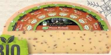
Bio Nuss Rebell

Österreichischer Schnittkäse aus Bio-Bergbauern-Heumilch, mind. 50% Fett i. Tr., mit knackigen Walnussstückchen im Teig, aromatisch, sahnig mild, 100 g