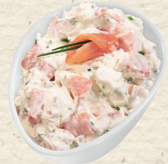
Aus eigener Herstellung: Frischkäse mit Räucherlachs

Deutscher Schnittkäse aus Kuh-Rohmilch, mind. 50% Fett i. Tr. aus bester Allgäuer Milch, mind. 3 Monate gereift, Rinde mit Orangenpfeffer veredelt, feinwürzig, weich, cremig, 100 g