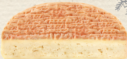
Epoisses Germain AOP

Französischer Weichkäse mit Trüffel aus Kuhmilch, mind. 60% Fett i. Tr., milde weiße Rinde, elfenbeinfarbig mit geschmeidiger Konsistenz, fein aromatisch im Geschmack, 100 g